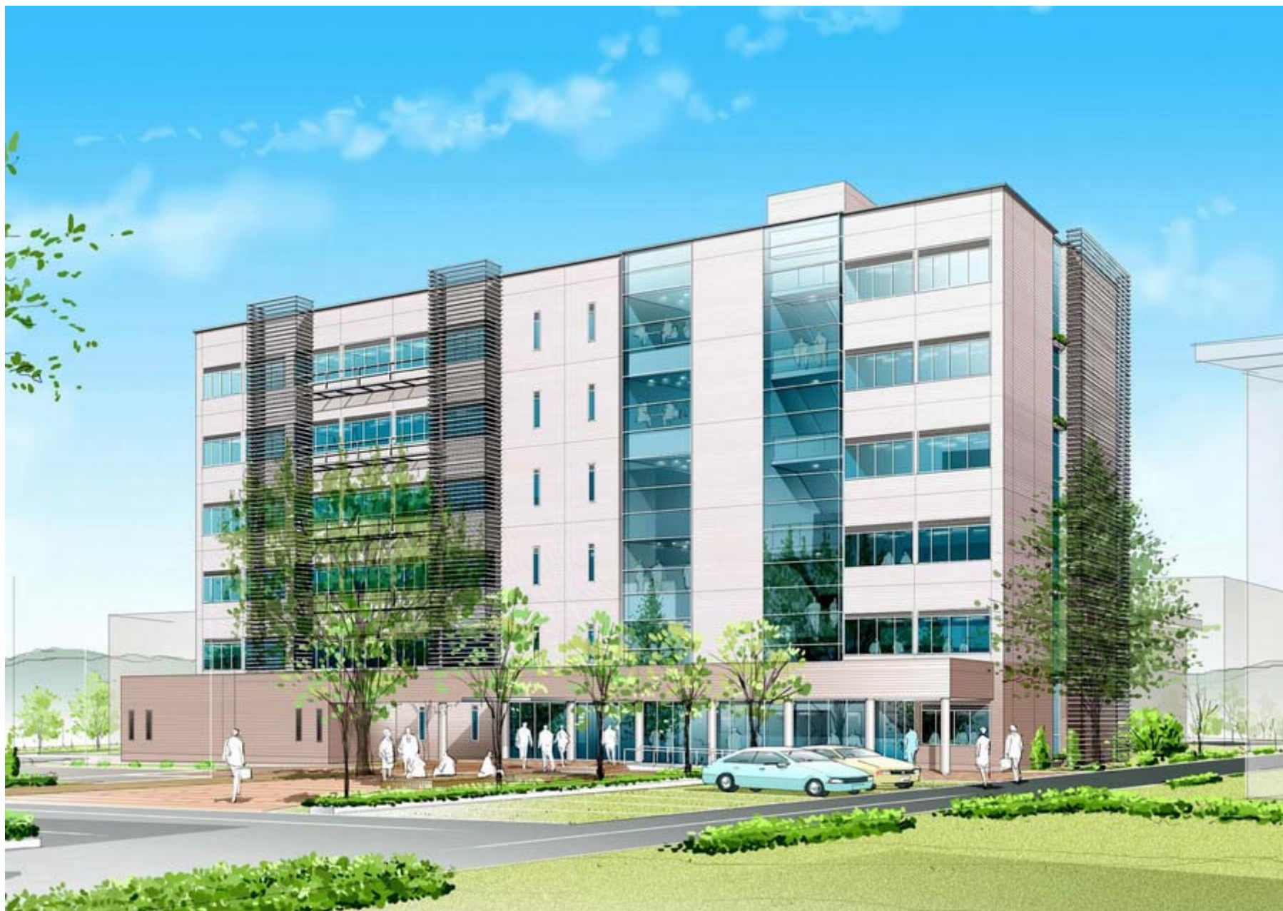
FII施設(ファイバーイノベーション・インキュベーター施設)外観イメージ図